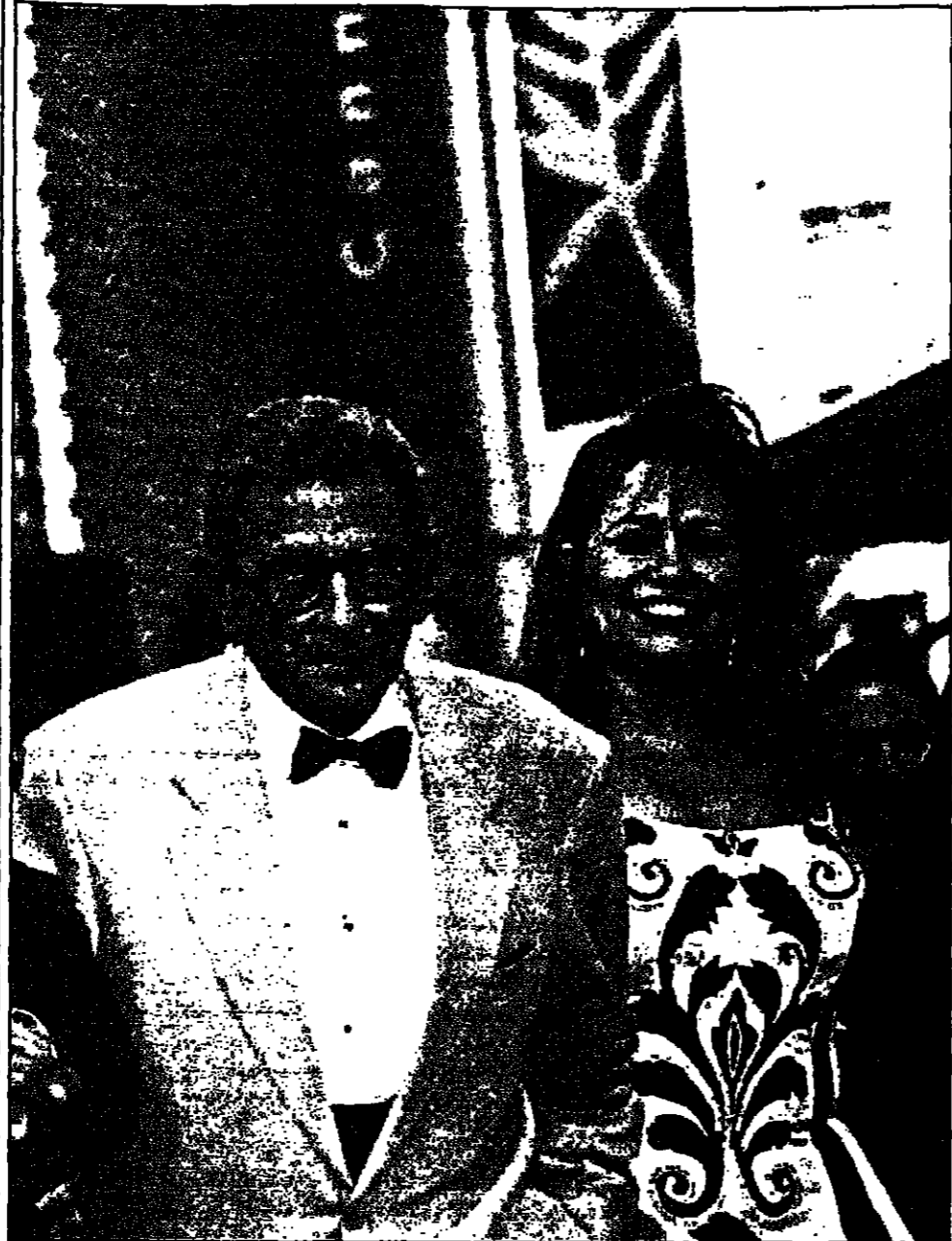
يوسف شاهين ولي ولي امرى نجمة فيلمه «المصري» في «كان»